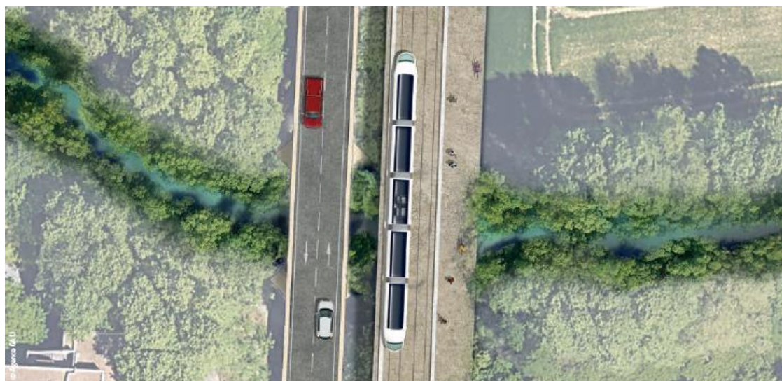
Vue aérienne du futur pont traversant La Lironde