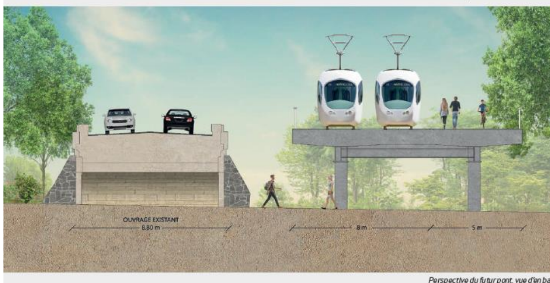
Perspective du futur pont, vue d'en bas