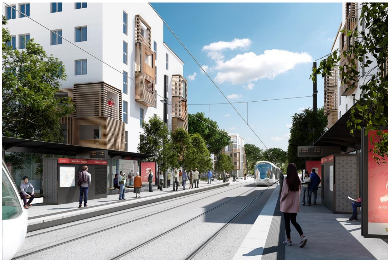
Perspective de la station Ligne 5 qui sera implantée place de Chine, au cœur du quartier Bagatelle – Val de Croze.

Attendue depuis 2017, la Ligne 5 apportera enfin une solution de transport en commun efficace aux habitants de l'Ouest et du Nord de la Métropole en 2025. 80 000 usagers voyageront chaque jour à bord de la 5 e ligne de tramway, véritable réponse collective à l'urgence sanitaire et écologique.